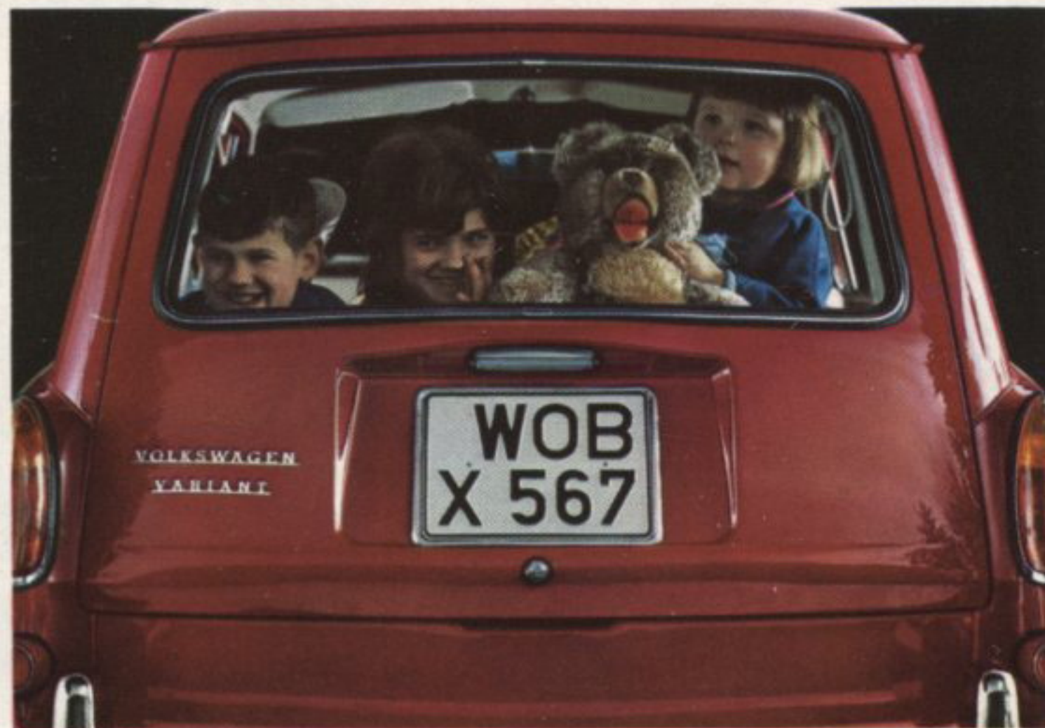
för hela familjen

— ja det mesta för de flesta får plats i Volkswagen 1500 Variant