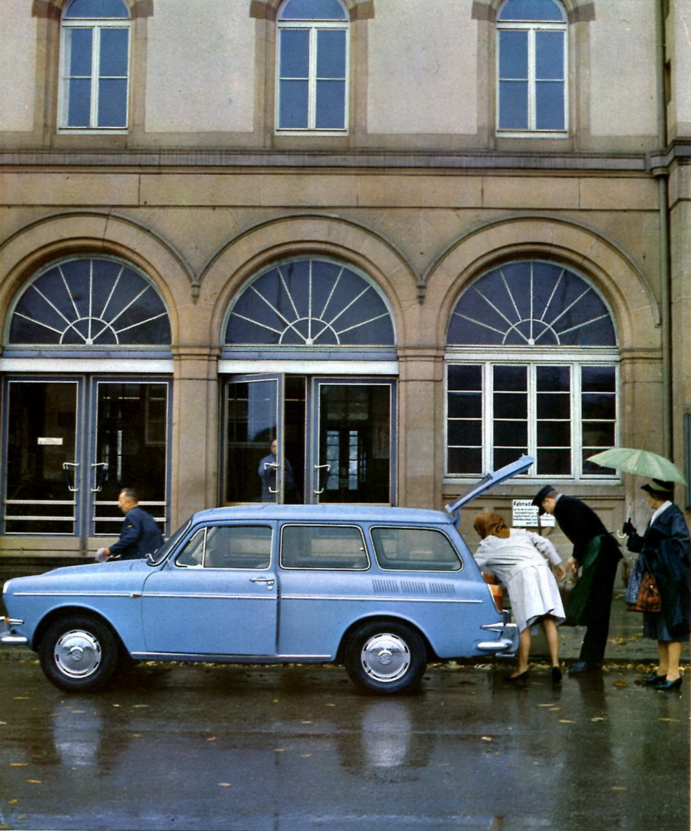
27.10 Man får gott och väl med sig halva garderoben i en VW Variant ...så ser man den...