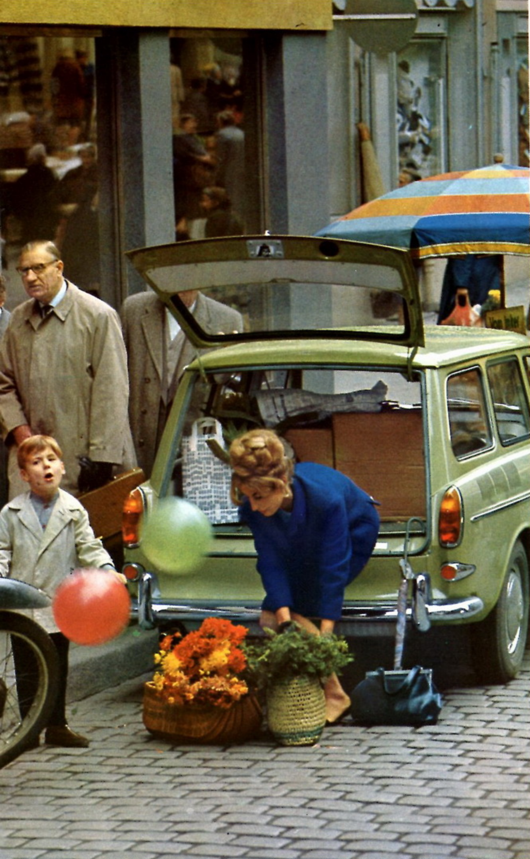
30.10 En VW Variant är med sina två bagageutrymmen den idealiska bilen när man skall handla.